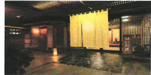
写真はすべてイメージです。

行程 ご自宅(ご出発)====お客様ご自身で====料亭 鎌仁別荘==== お食事 ====「ちひろの生まれた家」記念館====ご帰宅 世代を超えて愛される絵本画家、いわさきちひろの生れた家